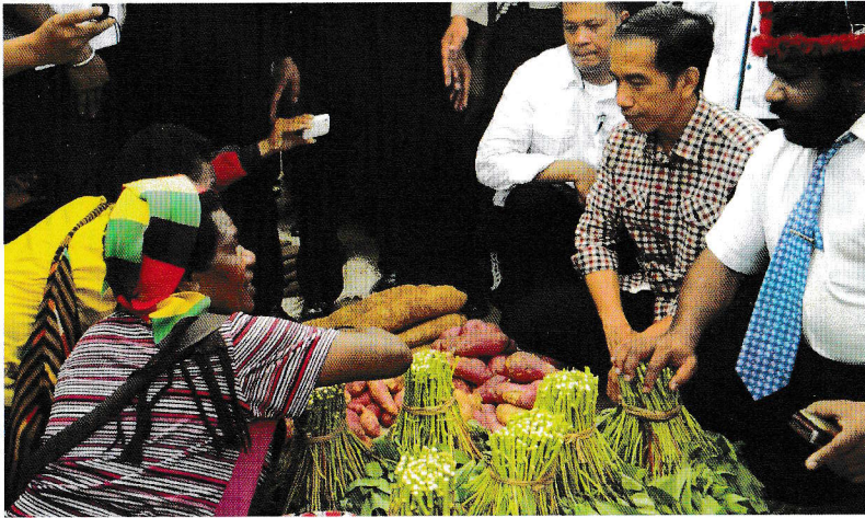
Jokowi op een markt in Papua.