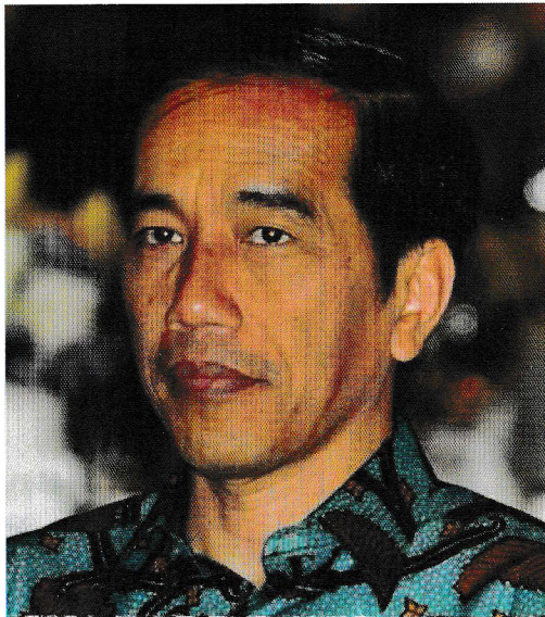
President Joko Widodo.